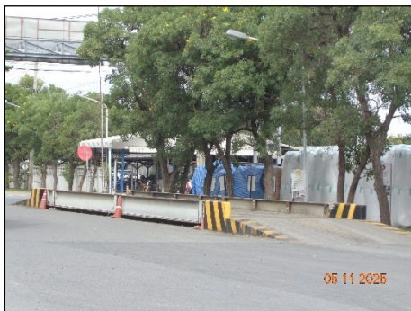
ภาพที่ 2.2-19 จุดซั้งน้ำหนักรถบรรทุก