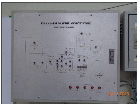
Fire Alarm Graphic Annunciator