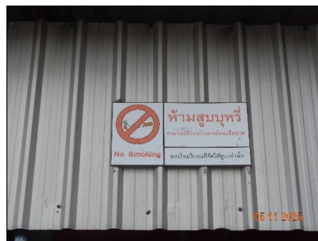
ภาพที่ 2.2-32 ป้ายห้ามสูบบุหรี่