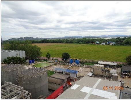
ภาพที่ 2.2-11 ระบบบำบัดน้ำเสีย