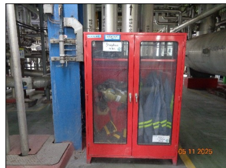
ตู้เก็บอุปกรณ์ดับเพลิง