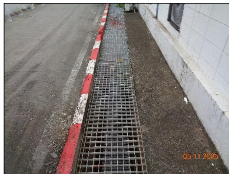
ภาพที่ 2.2-21 รางระบายน้ำฝน