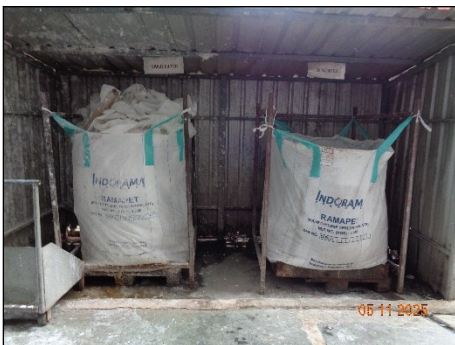
ภาพที่ 2.2-15 ถุง Jumbo Bag บรรจุ Oligomer