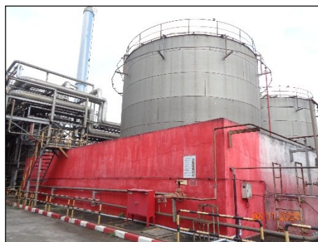
ภาพที่ 2.2-38 คั่นกันรอบถังเก็บ EG