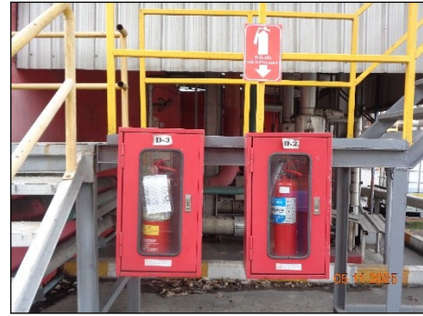
Fire Hose Cabinet