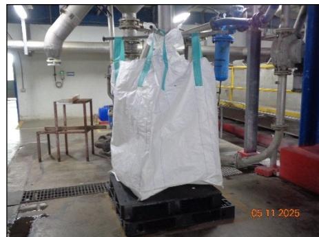
ภาพที่ 2.2-16 ถุง Jumbo Bag บรรจุ Polymer Lump & Chips