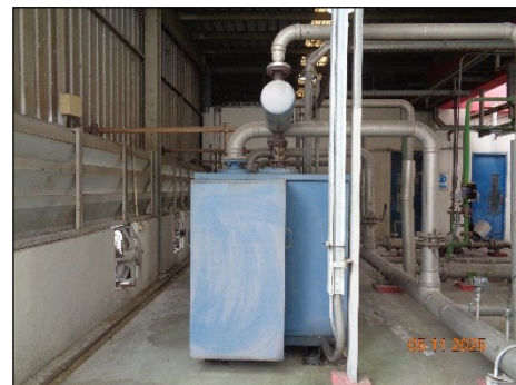
ภาพที่ 2.2-8 Silencer ของเครื่อง Compressor