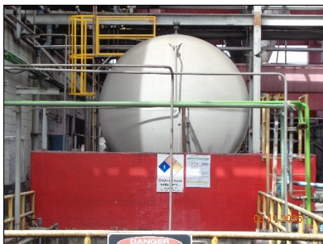
ภาพที่ 2.2-39 คั่นกันรอบถังเก็บ EG Daily Tank