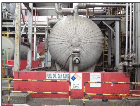
ภาพที่ 2.2-37 คั่นกันรอบถังเก็บ Fuel Oil Daily Tank