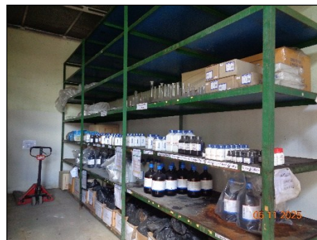
ภาพที่ 2.2-29 พื้นที่เก็บสารเคมีภายในอาคาร