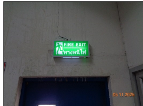
ป้ายแสดงทางหนีไฟ