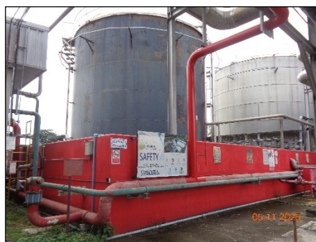
ภาพที่ 2.2-36 คั่นกันรอบถังเก็บ Fuel Oil