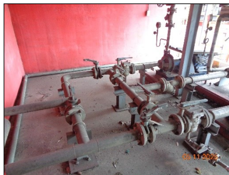
ภาพที่ 2.2-34 วาล์วปิด-เปิด ท่อสารเคมี ที่อยู่นอกคั่นกันสารเคมี