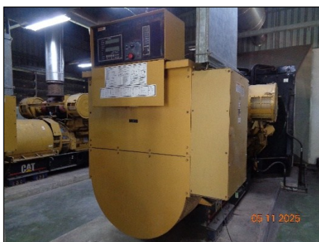
ภาพที่ 2.2-9 Silencer ของเครื่อง Diesel Generator