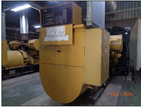
ภาพที่ 2.2-5 ระบบไฟฟ้าสำรอง Diesel Generator