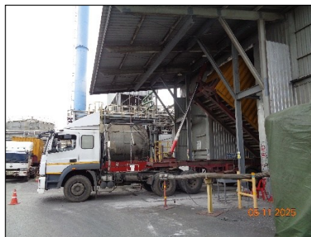
ภาพที่ 2.2-4 รถบรรทุกขณะจอดเพื่อขนถ่ายวัสดุดิบ