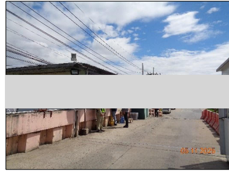
ภาพที่ 2.2-18 พนักงานรักษาความปลอดภัย บริเวณทางเข้า-ออก โครงการ