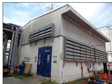
ภาพที่ 2.2-10 อาคารที่ภายในติดตั้งเครื่อง Diesel Generator