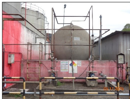
ภาพที่ 2.2-40 คั่นกันรอบถังเก็บ DEG