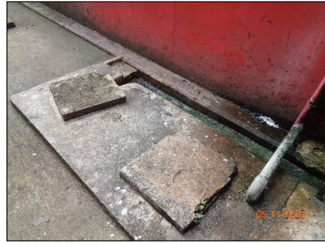
ภาพที่ 2.2-12 บ่อเกรอะ (Septic Tank)