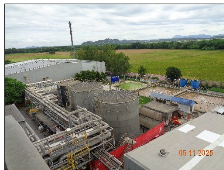
ภาพที่ 2.2-31 ระบบสเปรย์น้ำรอบถังเก็บ EG