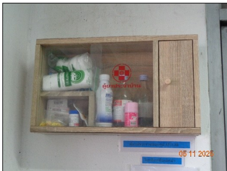
ภาพที่ 2.2-24 ตู้ปฐมพยาบาลเบื้องต้น