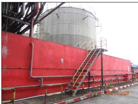
ภาพที่ 2.2-33 Elevated Walkway