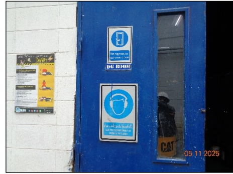
ภาพที่ 2.2-6 ป้ายเตือนให้สวมใส่อุปกรณ์ ป้องกันเสียงดัง