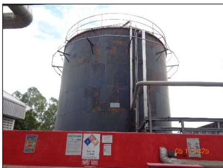
ภาพที่ 2.2-30 ระบบสเปรย์น้ำ รอบถังเก็บน้ำมันเชื้อเพลิง