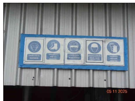
ภาพที่ 2.2-27 การติดป้ายเตือนเรื่องความปลอดภัย ในการทำงาน ในบริเวณต่างๆ