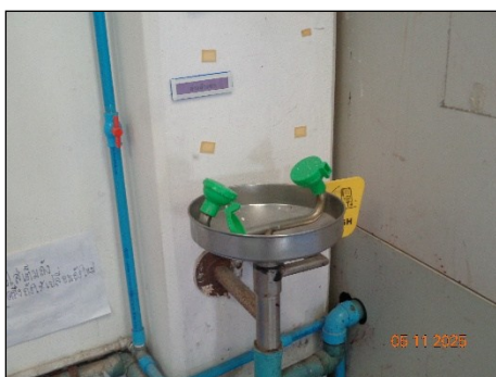
ภาพที่ 2.2-26 ฟักบัวฉุกเฉินและที่ล้างตา