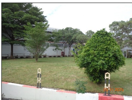
ภาพที่ 2.2-35 พื้นที่สีเขียวของโครงการ