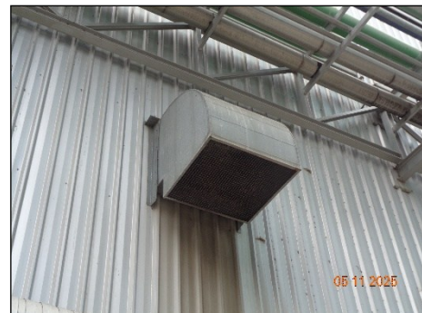
ภาพที่ 2.2-25 การจัดการเรื่องการระบายอากาศ