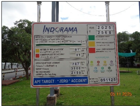
ภาพที่ 2.2-22 ป้ายแสดงสถิติอุบัติเหตุ