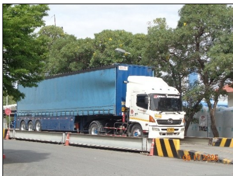
ภาพที่ 2.2-3 รถบรรทุกผลิตภัณฑ์