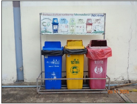
ภาพที่ 2.2-17 ถังขยะที่มีฝาปิดมิดชิด