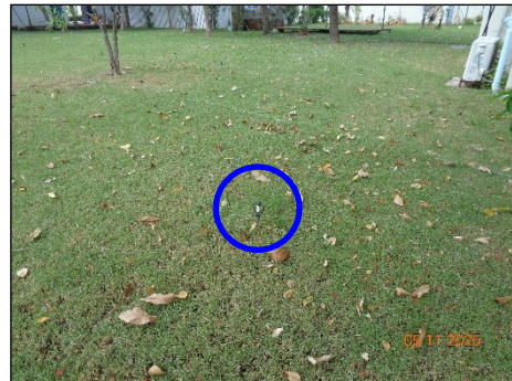
ภาพที่ 2.2-14 การนำน้ำหลังผ่านการบำบัด มาใช้รดน้ำต้นไม้