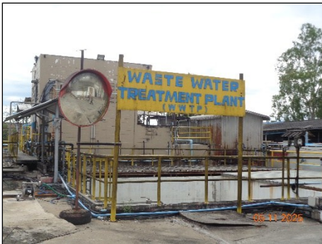
ภาพที่ 2.2-13 บ่อพักน้ำทิ้งฉุกเฉิน