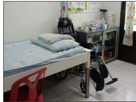
ภาพที่ 2.2-23 ห้องปฐมพยาบาล