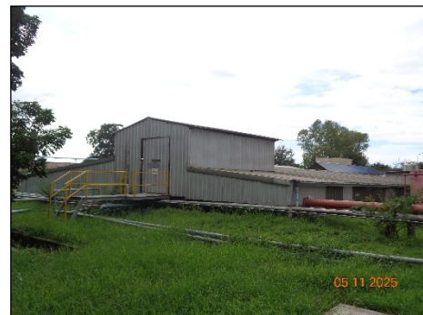
ภาพที่ 2.2-20 Water Pond