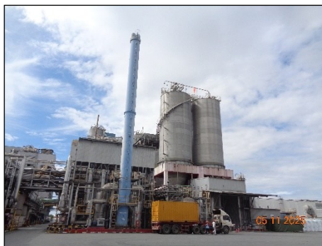
ภาพที่ 2.2-1 HTM Heater Stack