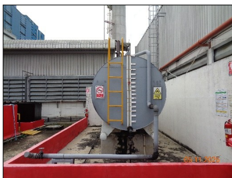
ภาพที่ 2.2-41 คั่นกันรอบถังเก็บ Diesel Oil